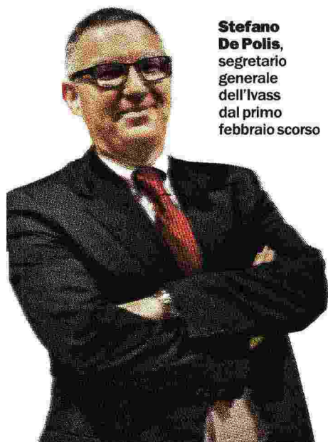
Stefano De Polis , segretario generale dell'Ivass dal primo febbraio scorso