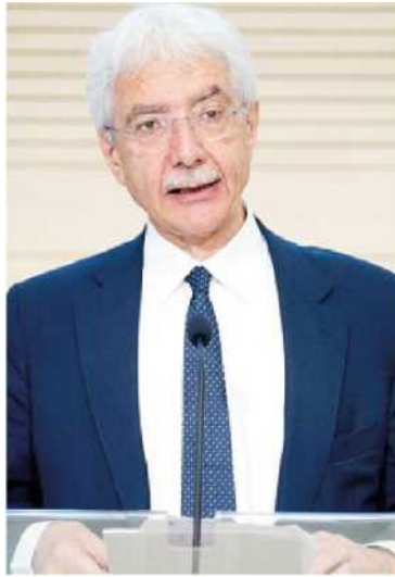
Bankitalia. Salvatore Rossi